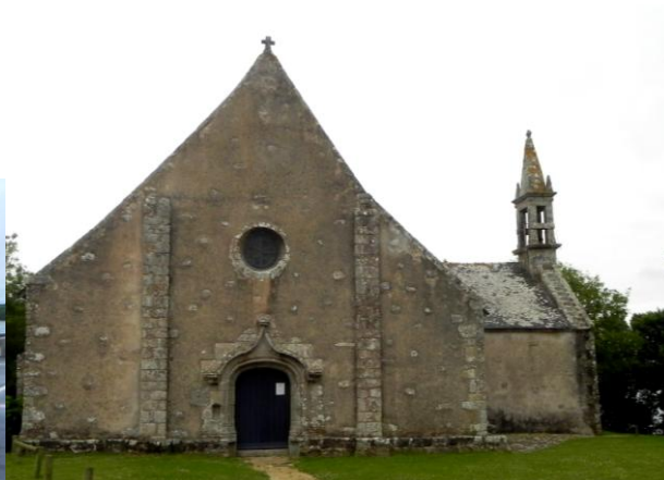
La Chapelle de St Cado