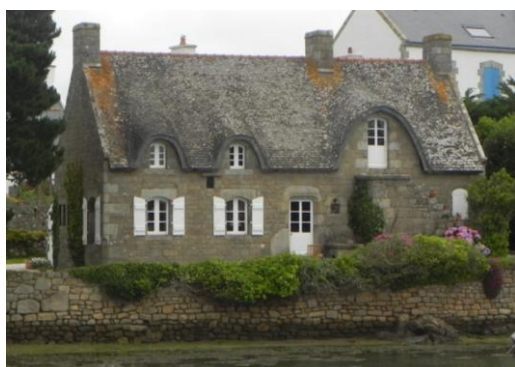
Ce qui reste du Prieuré