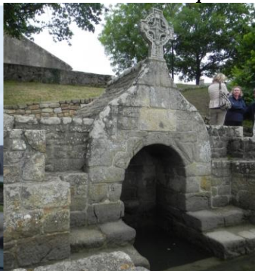
Le Calvaire et la Fontaine de St Cado