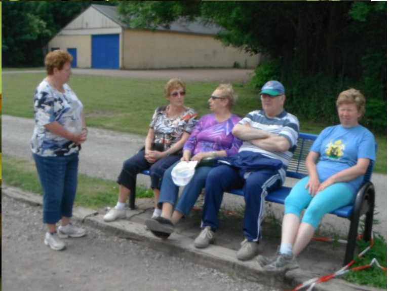
Le Repos des Guerriers