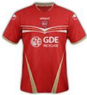
Maillot au stade du Hainaut