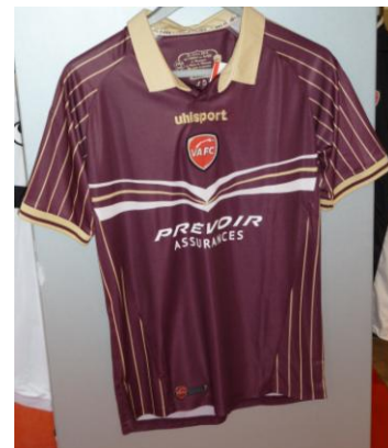
Match à l'extérieur