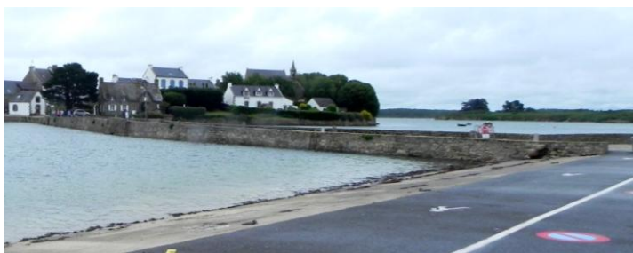
Le pont de St Cado objet du litige

En vacance dans le golfe du Morbihan nous sommes allés faire le tour de l'Etel en bateau. Nous sommes passés près d'une ile appelée l'ile de St CADO. Sur cette ile un moine ermite chassé par les Saxons est venu s'établir en 525 après JC. Il a commencé par mettre le feu à toute l'île pour détruire tous les serpents et nuisibles et a construit une chapelle et un prieuré. Il s'est ensuite attaché à construire un pont de bois pour relier l'île à la terre toute proche. Une tempête s'est chargée de le détruire, il en a reconstruit un second qui fût lui-même détruit par une seconde tempête. C'est ici que la légende intervient, il aurait soit disant pactisé avec le diable pour construire un pont de pierre. Le diable a donné son aide sous réserve que l'âme du premier utilisateur lui soit remise. Le saint a accepté ce pacte et le lendemain matin, le pont de pierre était construit. A ce moment Satan a réclamé l'objet du marché conclu, saint CADO ne voulant pas donner une âme humaine fit passer en le poursuivant un chat noir sur le pont, devant la fureur du diable et de sa mère, il eu le temps de bénir le pont avant sa destruction. C'est ainsi que naquit la malédiction des chats noirs. L'ermitage devint la propriété des moines bénédictins de Quimperlé en 1089.