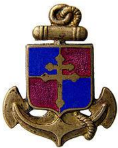
Insigne de poitrine à gauche