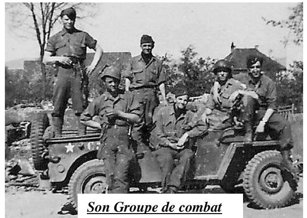
Son Groupe de combat