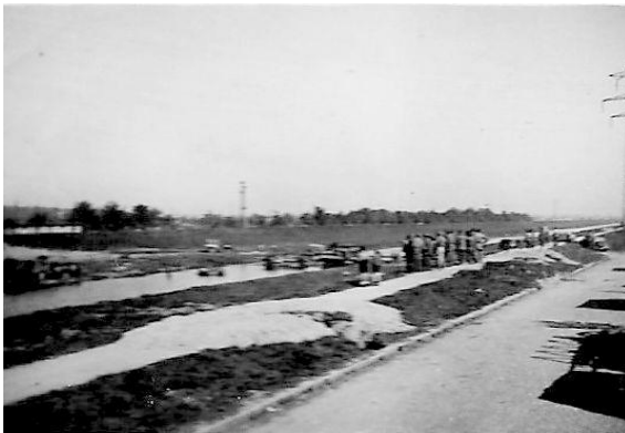
Passage d'une rivière