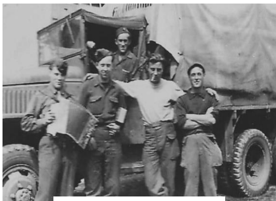
Enfin la LIBERATION