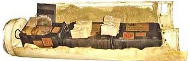
Conteneur de parachutage à la Résistance