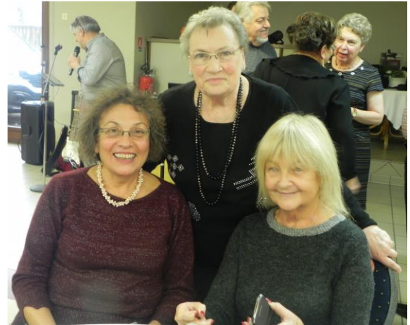
Nos Amies Parisiennes