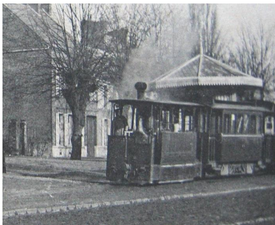
Terminus Place de Raismes

C'est à la fin du XIX siècle que le Tramway a été installé à Valenciennes. Le Tramway fonctionnera à partir de 1881 et face à la concurrence routière, il cessera définitivement son activité le 2 juillet 1966.