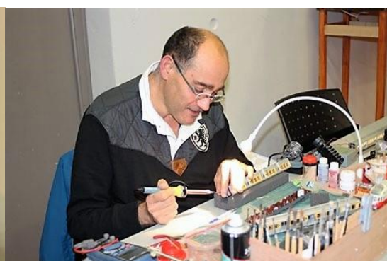
Soudeur en opération de câblage

L'Amicale Amandinoise de Chemin de Fer de la Scarpe exposait des photos des rénovations des locomotives à vapeur de 1911 et 1917 en voie de 60. Avis aux amateurs pour un petit tour les dimanches de mai à septembre, départ chemin des Hamâides à Saint Amand.