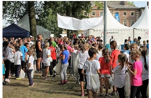
Table gonflée mouvante ou toboggan sans oublier de se déchausser : bref tout est bien mais malheur à celui qui ne peut se garer : barrières, interdictions en risquant la fourrière etc. Heureuse initiative : des navettes reliant le parking Auchan avec la Place de Raismes. Bravo les gars et déjà pensez à 2017 vous ne serez pas déçus !

En flânant sur la place de rassemblement je n'ai pas rencontré les Alstom certainement plus préoccupés par les événements actuels mais par contre des clubs venus de loin tel Beauvais reconnaissable à son maillot rose fluo de belle allure. Après l'effort le réconfort, casse-croute en mains on commente sa course, d'autres sont plus confortablement installés aux tables et pourquoi pas avec une consommation à bonne portée. Les petits après avoir dégusté les récompenses alimentaires reçues dès leur arrivée ont vite retrouvé les jeux :