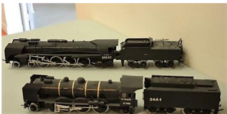
Locomotives fabriquées en carton