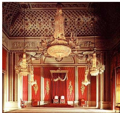
Salle du Trône