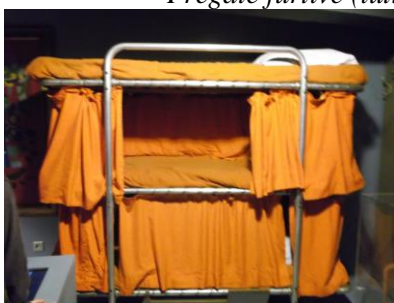
Lit d'homme de troupe (bannette)

C'est ainsi que s'achève la visite du musée de Brest, classé au second rang des musées de la Marine Française après celui de Paris.