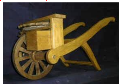
Créée par Léonard de VINCI