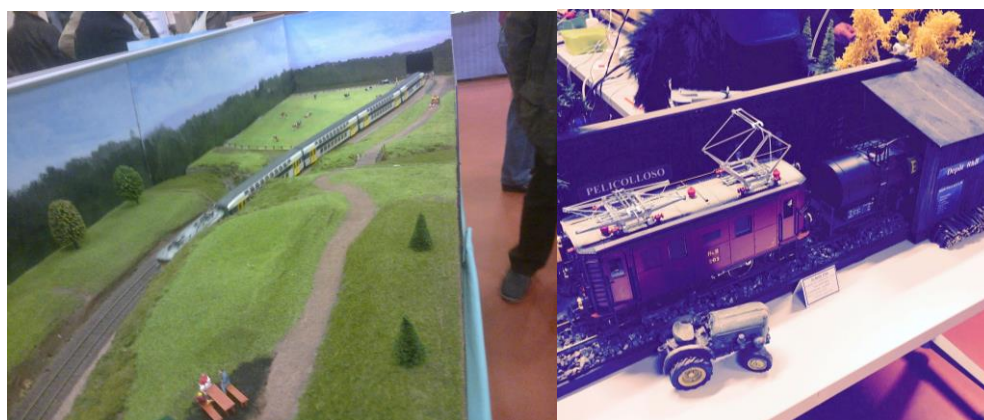
•Le chemin de fer du Cambrésis