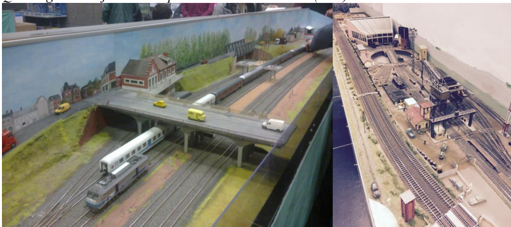
• La gare du faubourg de Paris

Quatre grands sujets étaient présentés à l'échelle HO (1/87) :