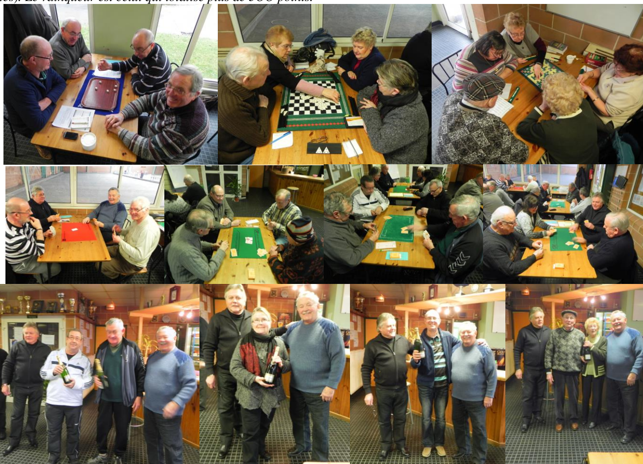
Remise des trophées

Triomino : Peut se jouer de 2 à 6 personnes comme aux dominos. Chaque joueur tire 7 triangles et retourne le 8 ème sur la table : cette pièce est remise à la pioche ; le plus haut total commence la partie. Le jeu consiste à faire coïncider les triangles entre' eux en faisant attention que les chiffres face à face soient bien les mêmes. La partie se joue en 500 points (donc plusieurs séries). Le vainqueur est celui qui totalise plus de 500 points.