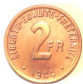
Pièce de 2f frappée à Londres