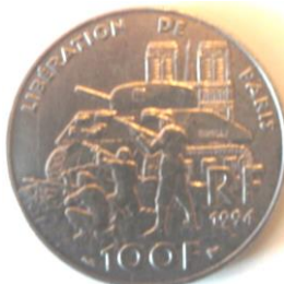
Pièce de 100f libération de Paris en argent