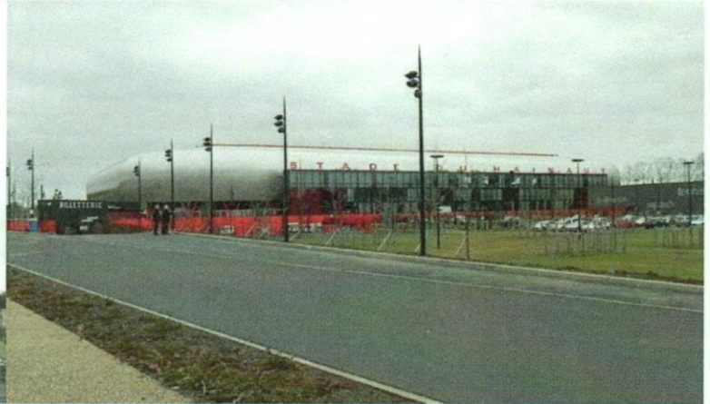
Stade du HAINAUT