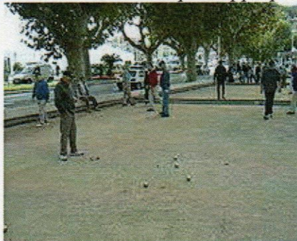
Joueurs de pétanque à Cannes